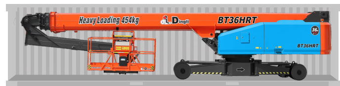
Перевозка в стандартном контейнере