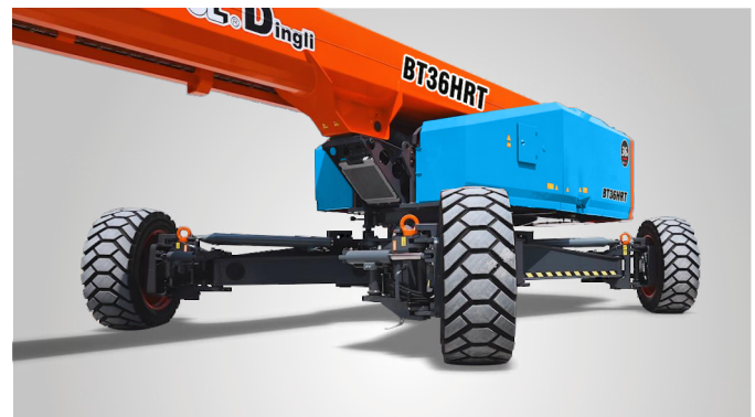
Совершенно новая технология выдвижения мостов одной кнопкой на месте эксплуатации. Глобальная патентная защита