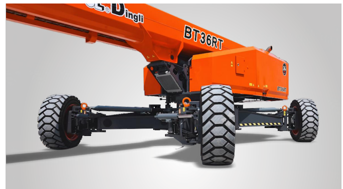
Совершенно новая технология выдвижения мостов одной кнопкой на месте эксплуатации. Глобальная патентная защита