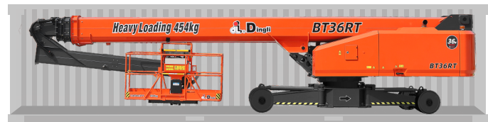
Перевозка в стандартном контейнере